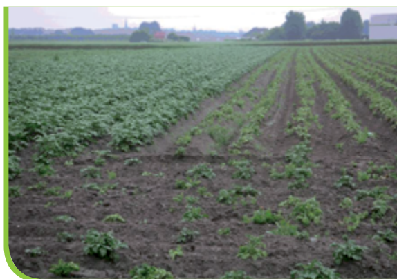
V raste spomalené a poškodené plodiny.