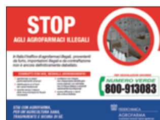
Nálepka a reklama z Talianska s rozširovaním čísla horúcej linky.