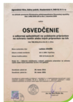
Osvedčenie o odbornej spôsobilosti vydávané na Slovensku.