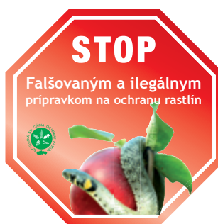
Slovenská nálepka používaná v kampani proti falšovaniu.