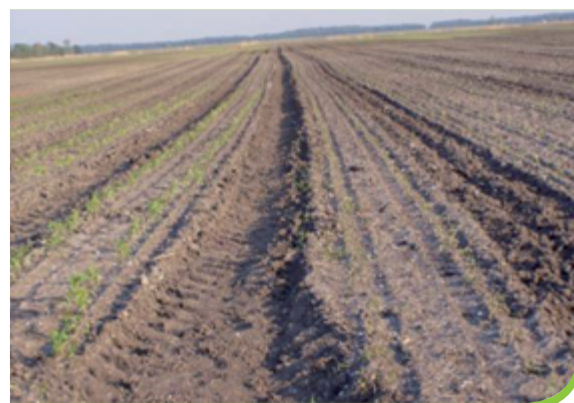
Plodiny úplne zničené po použití falšovaných prípravkov, ktoré zanechávajú v pôde potenciálne jedovaté rezíduá. Tieto nepriaznivo ovplyvňujú následné plodiny.