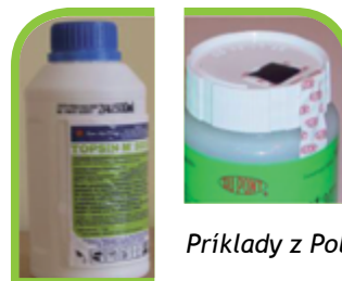
Príklady z Poľska.