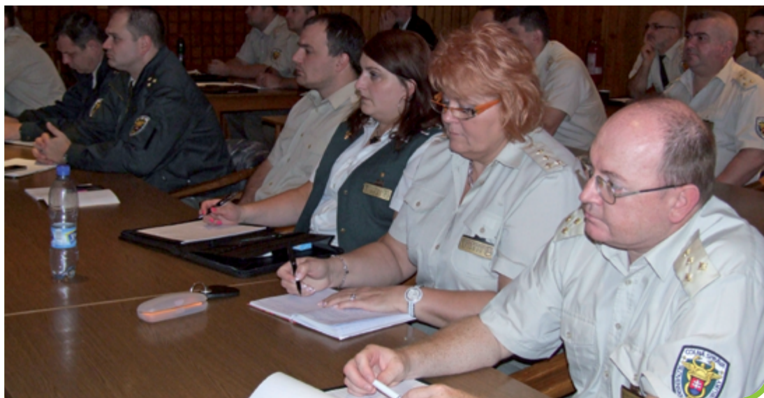
Školenie silových zložiek Slovenskou asociáciou ochrany rastlín.