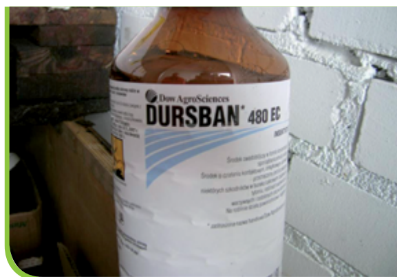
Falšované prípravky - označené a balené.