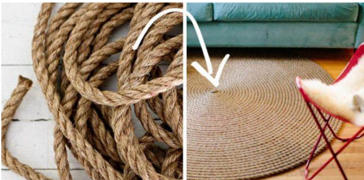
Obr. 1 - Koberec z odpadového špagátu